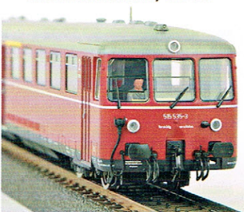
Roco Baureihe 515/815 DB