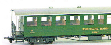
Bemo Plattform- Reisezugwagen RhB